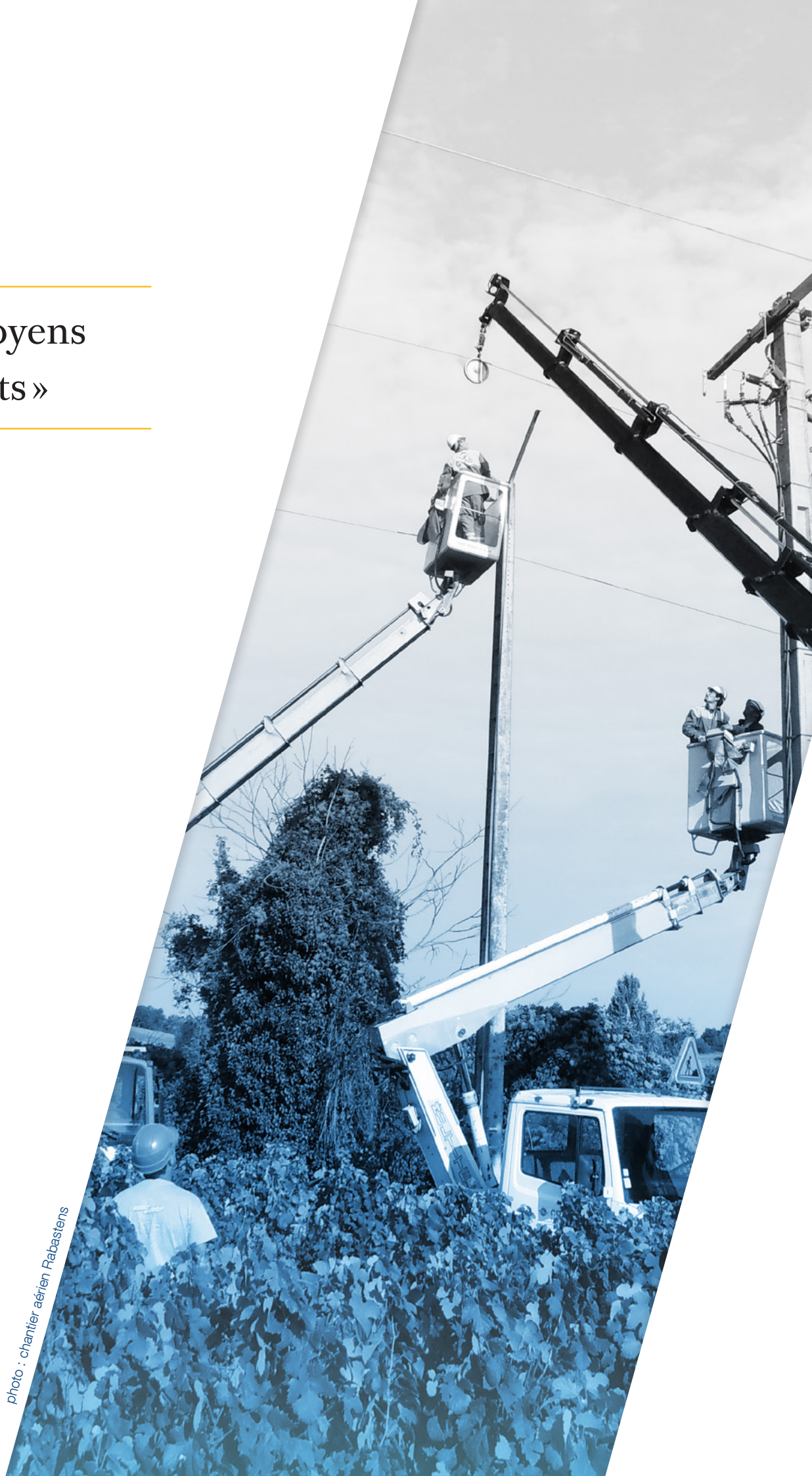
photo : chantier aérien Rabastens