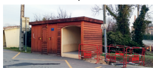
Intégration d'un poste

Photo Plantation d'un arbre pour la compensation carbone