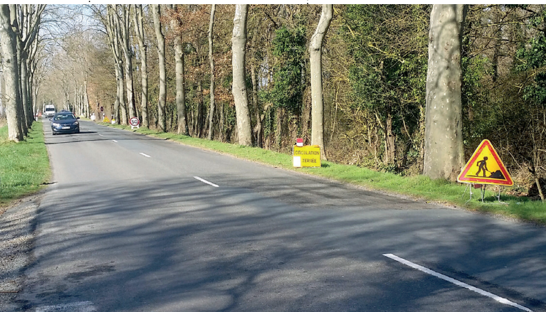
Photo Signalisation pour garantir la sécurité

Pour la santé et la sécurité de nos salariés [...] nous accordons une attention toute particulière au respect des règles de l'art.